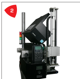
2 Compact, sans danger et facilement accessible pour l'opérateur.