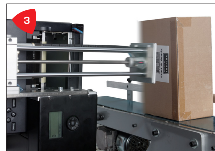
3 Polyvalent, appliquer des étiquettes sur le haut, le bas ou le côté dans l'angle de rotation.